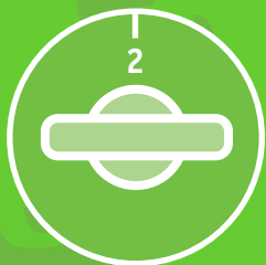
l'intensità della ventilazione